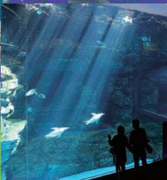
下關水族館「海響館」